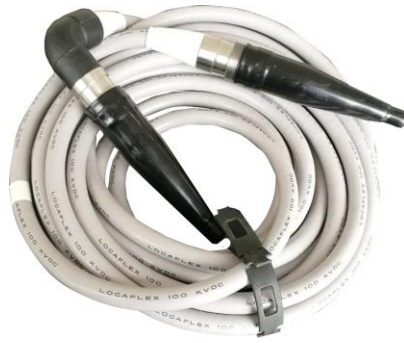
图 1-5 高压电缆