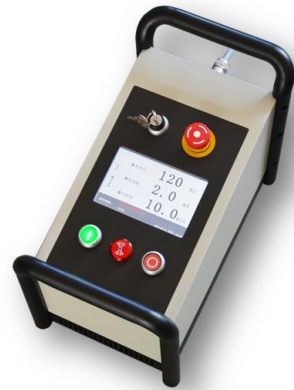
图 1-3 控制器