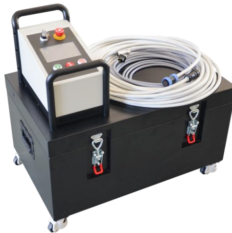
图 1-6 仪器箱